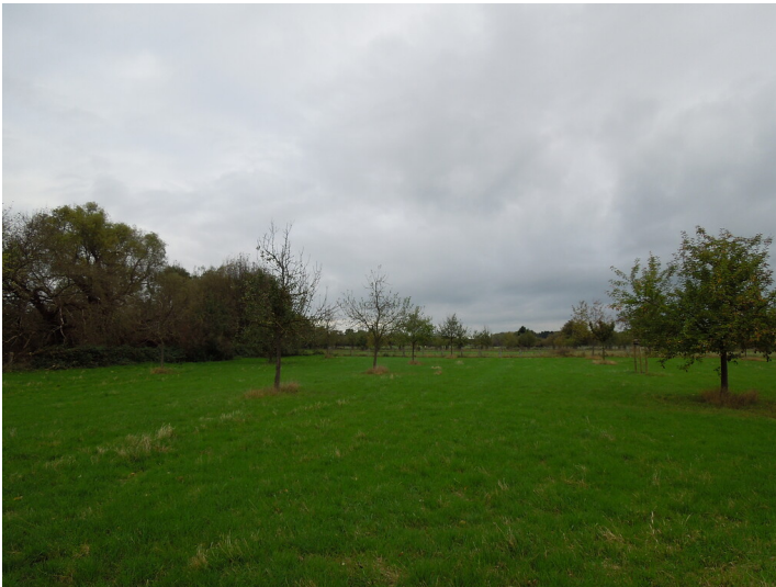
Blick auf die Streuobstwiese im Stadtteil Lechenich (2017)