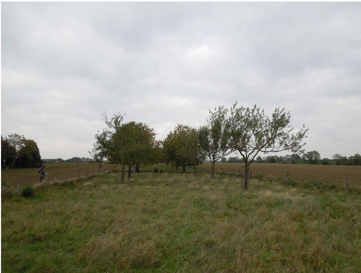
Blick auf die Streuobstwiese im Stadtteil Pütz (2017)