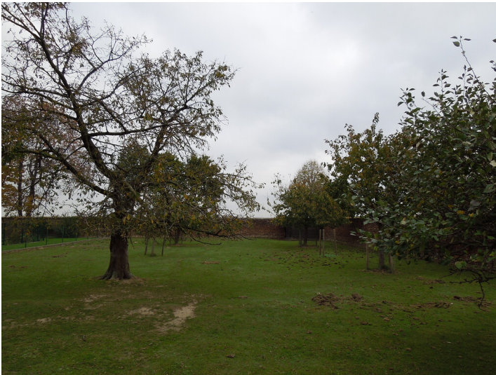
Blick auf die Streuobstwiese im Stadtteil Heppendorf (2017)