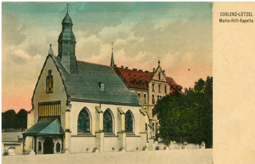
Kolorierte historische Postkarte der Maria-Hilf-Kapelle in Koblenz-Lützel (gelaufen um 1915).