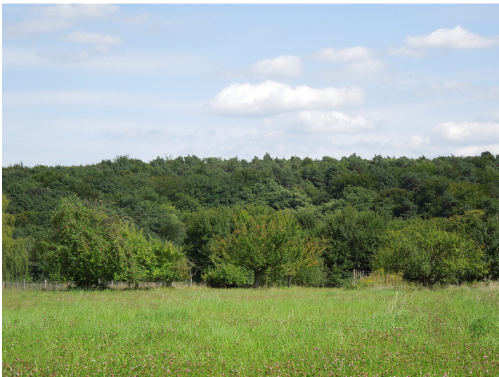
Blick auf die Streuobstwiese in Bonn-Röttgen (2017)