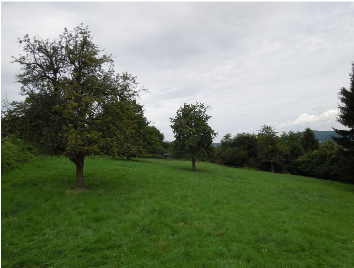
Blick auf die Streuobstwiese in Bonn- Lannesdorf (2017)