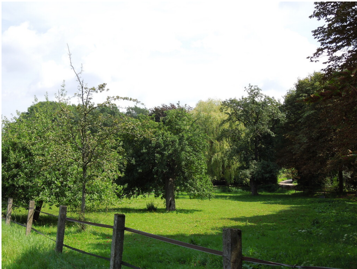
Blick auf die Streuobstwiese in Bonn- Mehlem (2017)