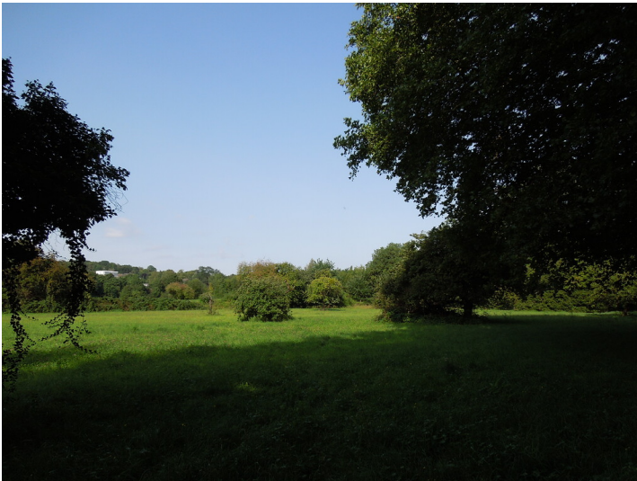
Blick auf die Streuobstwiese in Bonn- Mehlem (2017)