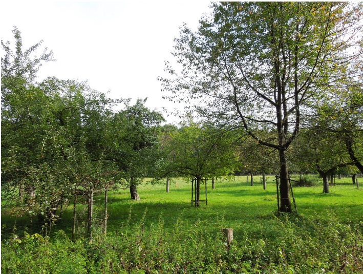
Blick auf die Streuobstwiese in Bonn-Röttgen (2017)