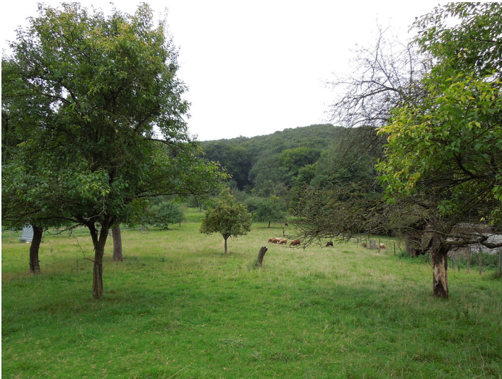
Blick auf die Streuobstwiese in Bonn- Friesdorf (2017)