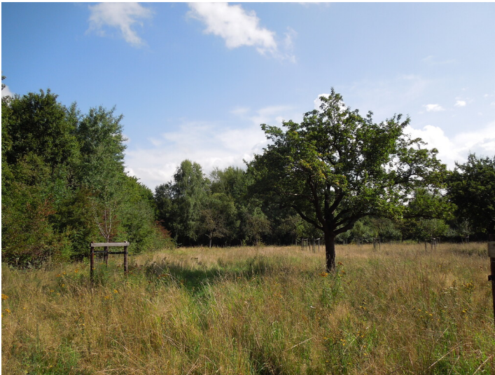
Blick auf die Streuobstwiese in Bonn-Lengsdorf (2017)