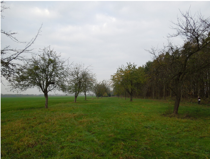
Blick auf die Streuobstwiese im Stadtteil Bergheim (2017)