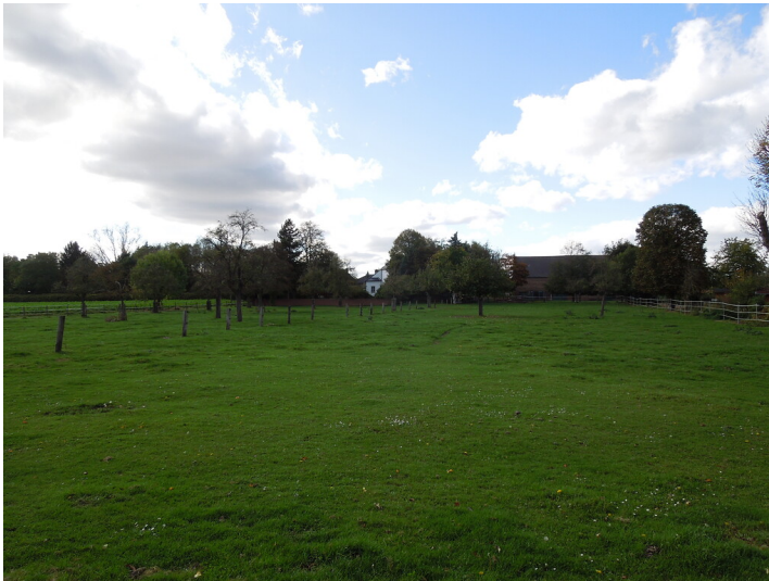
Blick auf die Streuobstwiese im Stadtteil Lechenich (2017)