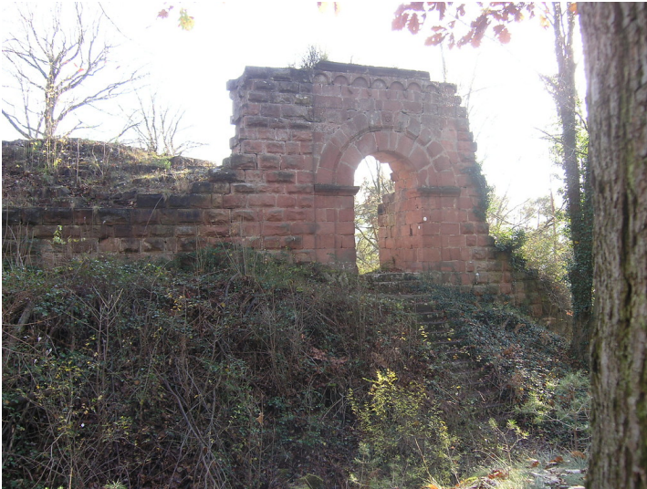
Das Kellergeschoss auf der Westseite der Burgruine Schlosseck (2006).