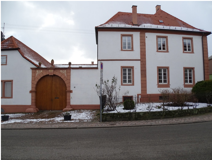
Barocke Hofanlage in Alsterweiler (2018)