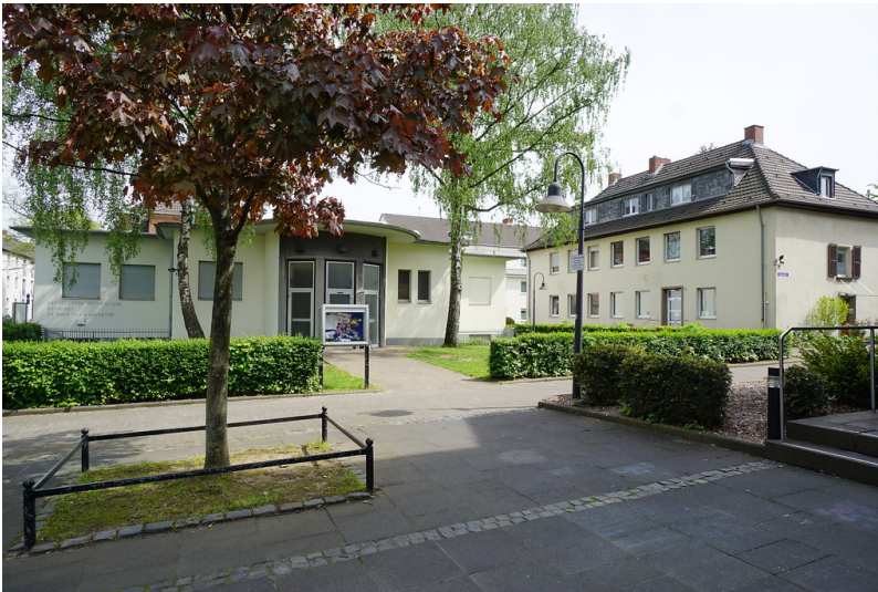
Pfarrhaus und Pfarrsaal St. Quirinus (2018)