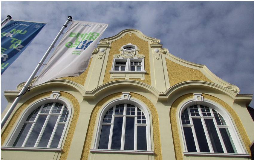
Oberer Bereich der östlichen Fassade des Bayer Erholungshauses in Leverkusen-Wiesdorf (2018)