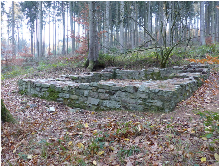
Limeswachturm Wp 3/69 "Am Bennerpfad" nördlich von Bad Homburg-Dornholzhausen (2018)