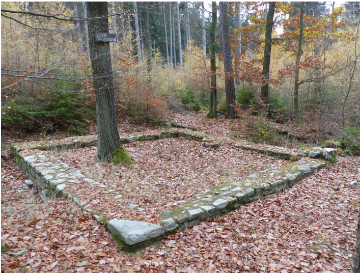
Limeswachturm Wp 3/68 "Fröhlichmannskopf" nördlich von Bad Homburg-Dornholzhausen (2018)