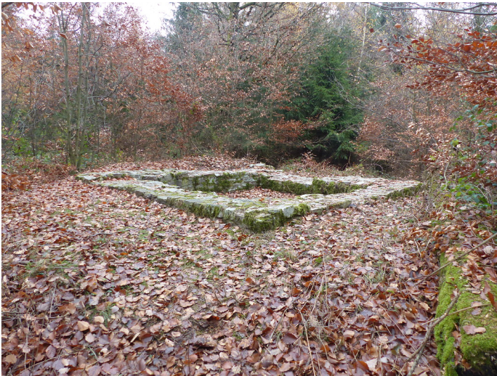
Limeswachturm Wp 3/63 westlich von Bad Homburg-Dornholzhausen (2018)