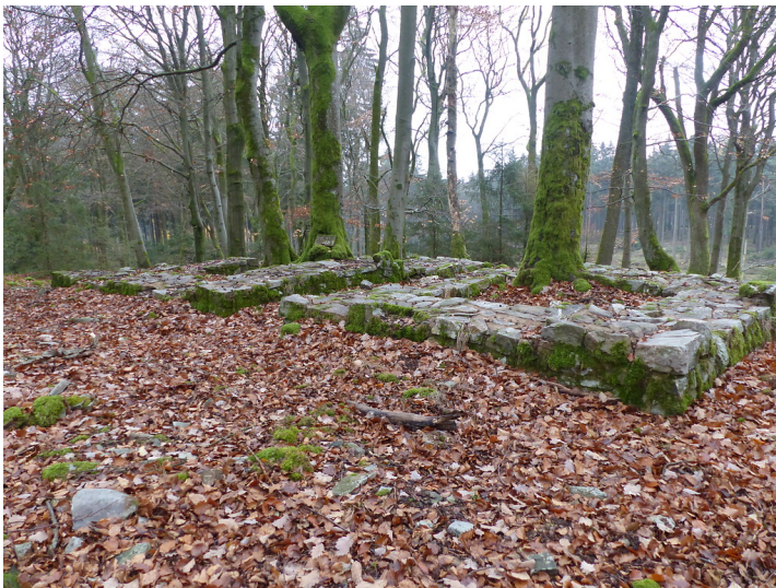
Limeswachturm Wp 3/61 "Kieshübel" westlich von Bad Homburg-Dornholzhausen (2018)