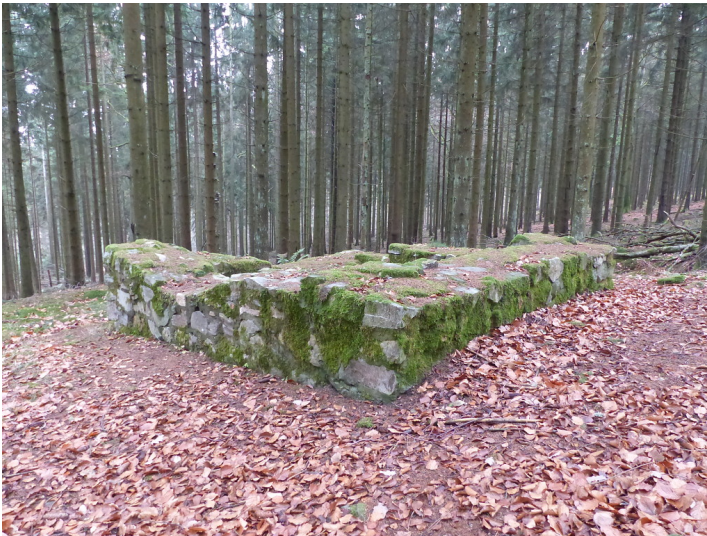
Limeswachturm Wp 3/60 "Einsiedel" westlich von Bad Homburg-Dornholzhausen (2018)