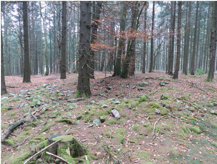
Limeswachturm Wp 3/59 "Am Roßkopf" westlich von Bad Homburg-Dornholzhausen (2018)