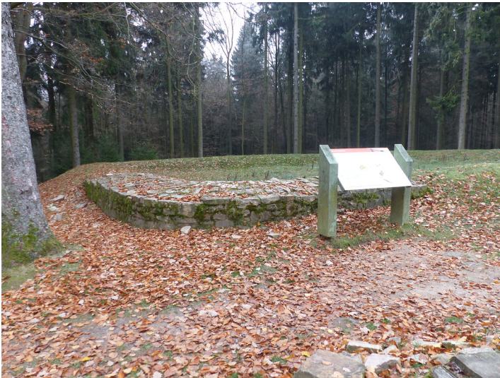
Kleinkastell Heidenstock östlich von Bad Homburg-Dornholzhausen (2018)