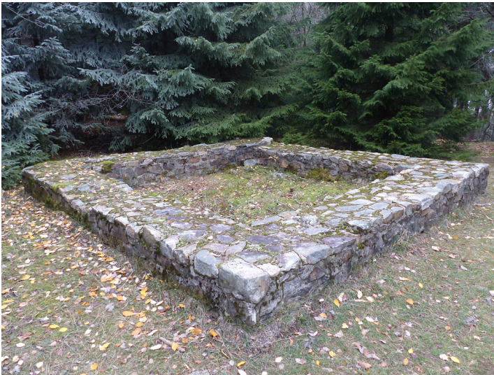
Rekonstruierter Grundriss des aus Stein errichteten Wachturmes 3/55 "Auf dem Klingenkopf" südlich von Neu-Anspach-Anspach (2018)