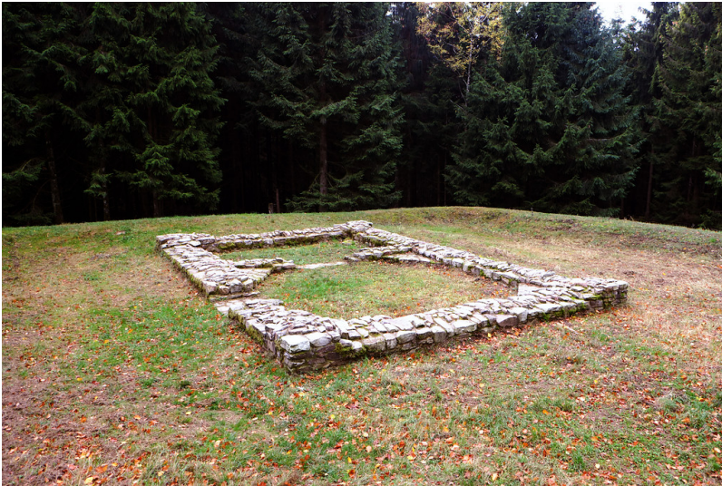
Konservierte Mauerreste des frühneuzeitlichen Jagdhauses innerhalb des Kleinkastells (2018)