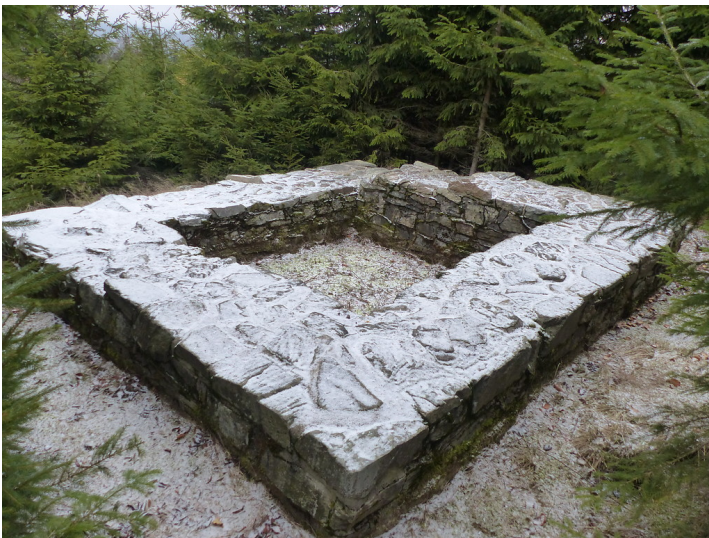
Limeswachturm Wp 3/50 "Am Steinkopf" südöstlich von Schmitten-Niederreifenberg (2018)