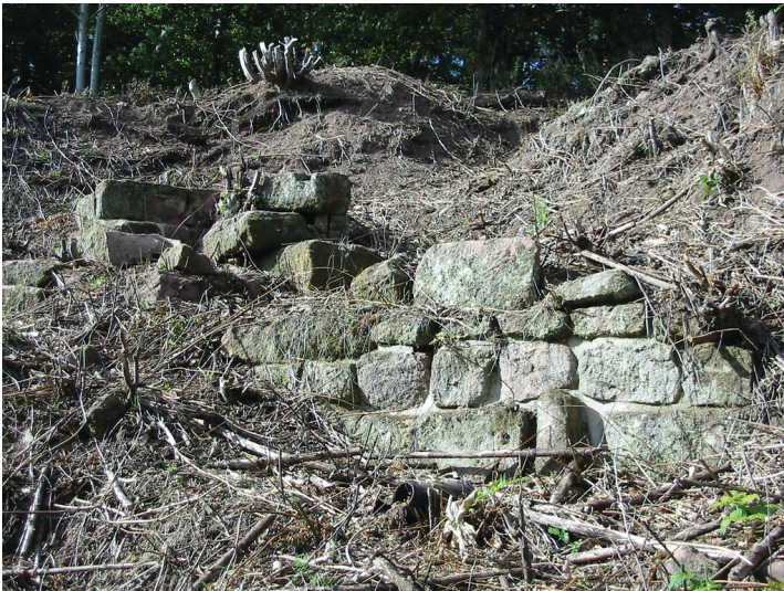
Quadersteine der westlichen Außenmauer der Burgruine Otterburg bei Otterberg (2004).