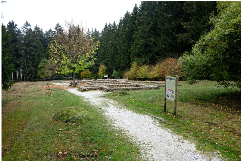
Feldbergkastell (2018)