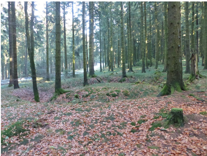
Limeswachturm Wp 3/45* "Rotes Kreuz" südlich von Schmitten-Niederreifenberg (2018)