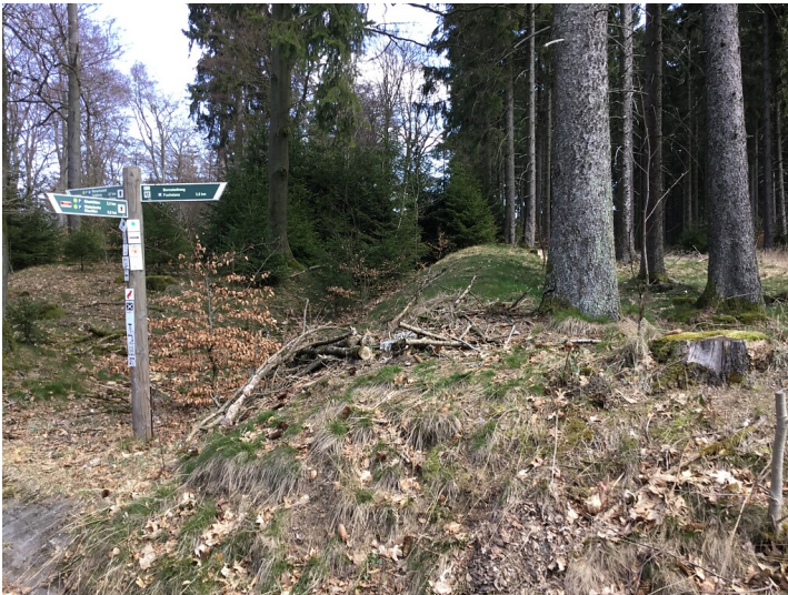
Limeswachturm Wp 3/45 Rotes Kreuz südlich von Schmitten-Niederreifenberg - Blick auf die Reste von Limeswall und -graben (2020)