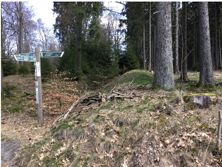
Limeswachturm Wp 3/45 Rotes Kreuz südlich von Schmitten-Niederreifenberg - Blick auf die Reste von Limeswall und -graben (2020)