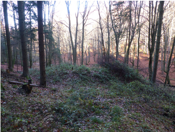
Limeswachturm Wp 3/43a "Im Emsbachtal" östlich von Glashütten (2018)