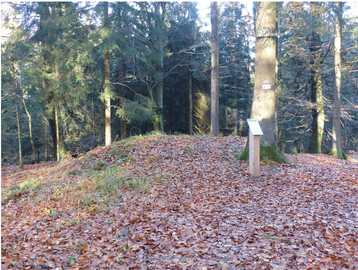
Limeswachturm Wp 3/43 "Auf der Weststeite der Emsbachschlucht" östlich von Glashütten (2018)