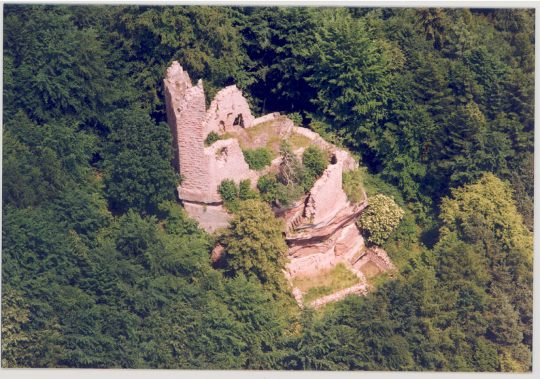
Burgruine Nieder-Breitenstein bei Esthal (1996).