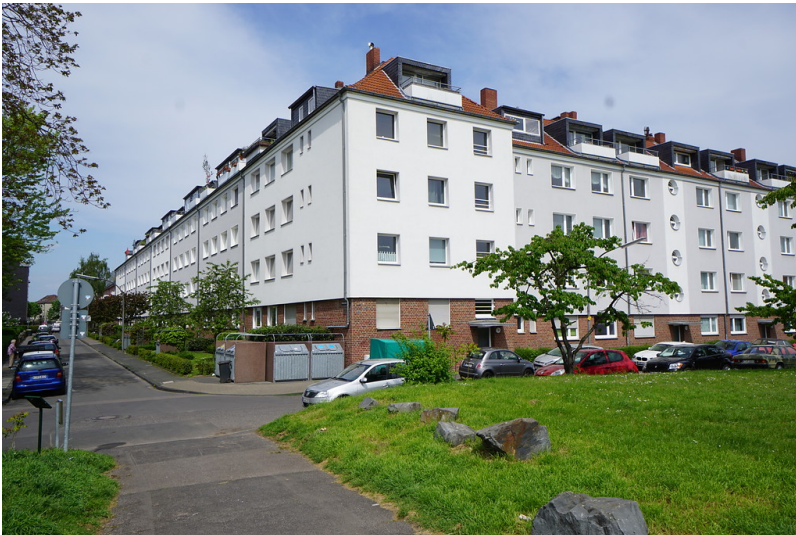
Genossenschaftssiedlung Eckewartstraße/Hildebrandstraße in Köln-Mauenheim