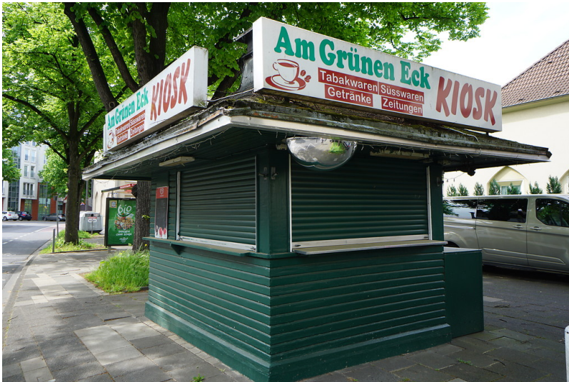
Kiosk "Am Grünen Eck" (2018)