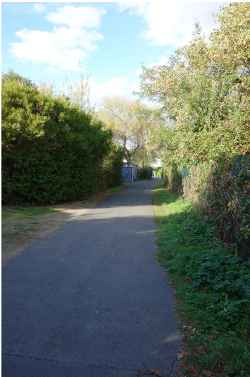
Historische Wegeverbindung "Schwarzer Weg" (2018)