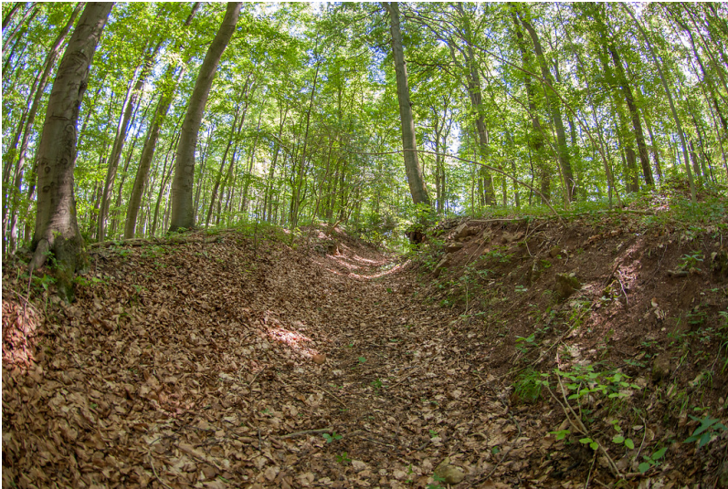
Nettersheim, Buirer Ley, Hohlweg, Blickrichtung Südost (2018).