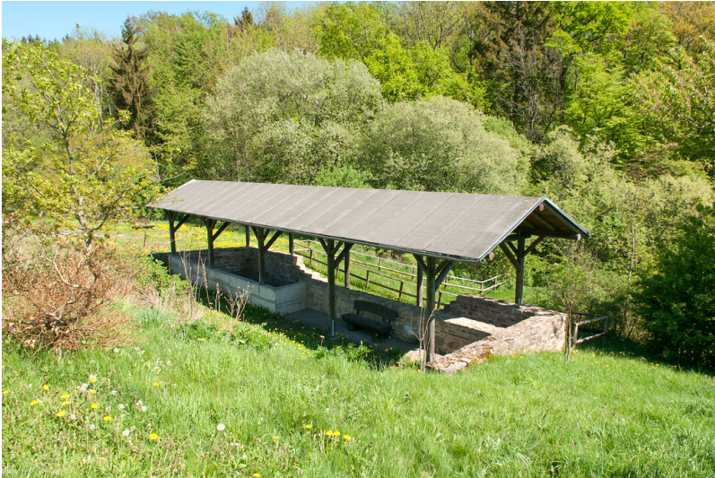
Blankenheim, Alte Quelle mit Schutzgebäude (2018)