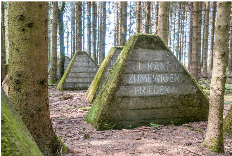
Hellenthal, Hollerather Knie. Panzersperre des Westwalls, Höckerlinie (2018)