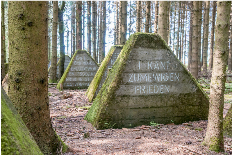
Hellenthal, Hollerather Knie. Panzersperre des Westwalls, Höckerlinie (2018)