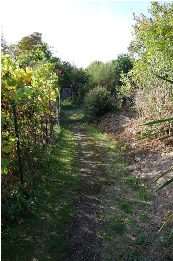
Schmaler Weg in der Kleingartenanlage Nippeser Tälchen (2018)