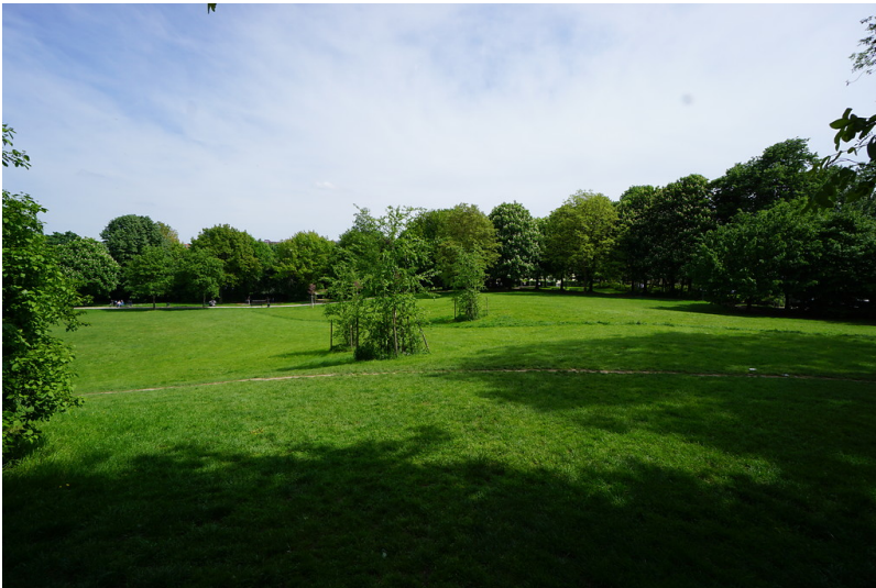
"Nippeser Tälchen"