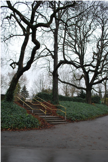
Standort des ehemaligen Rüsselerhofs (2014)