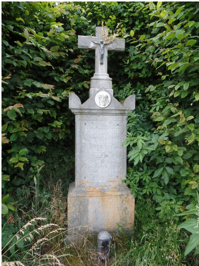
Wegekreuz Glehn, Kermeterstraße (2018)