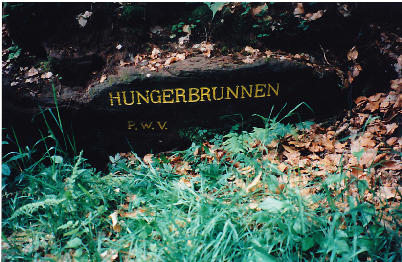
Ritterstein Nr. 165 "Hungerbrunnen" bei Diemerstein (1997)