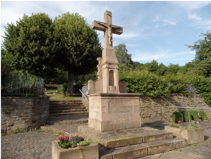
Friedhofskreuz Kallmuth (2018)