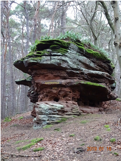
Ritterstein Nr. 164 Rattenfels bei Diemerstein (2019)