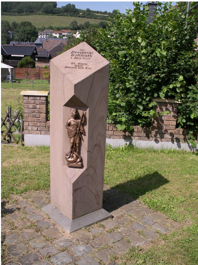
Bildstock St.-Georgs-Ritt, Gesamtansicht (2018)