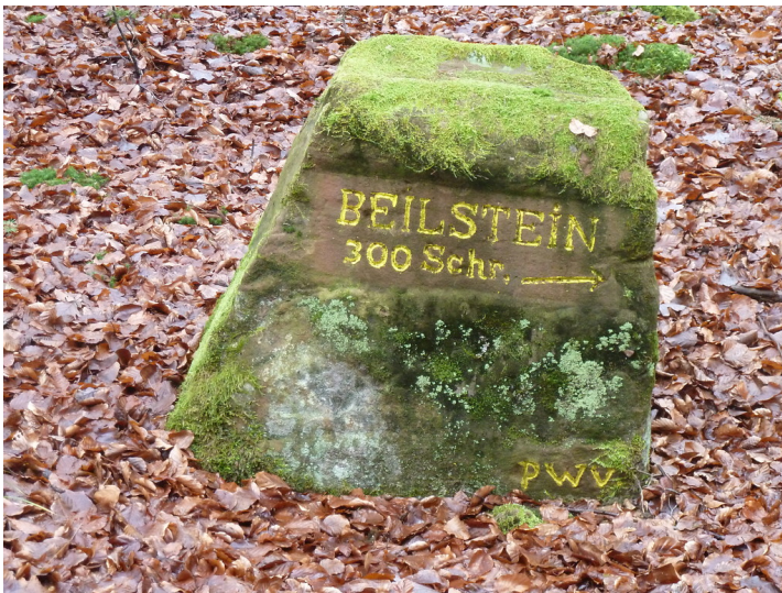
Ritterstein Nr. 162 "Beilstein 300 Schr." bei Kaiserslautern (2017)